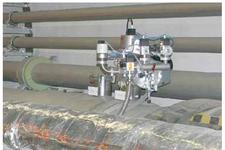
使用PKR 261 真空计进行真空测量