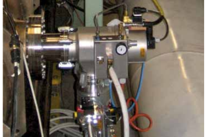
利用HiPace300涡轮分子泵获得电子束真空

普发真空专门研发了特殊的测量设备，用来测量获得的真空。这些使用的设备是改进的皮拉尼和冷阴极真空计。它们用来长期监测加速器内的压力，并确保当压力增加时可以采取适当的行动。由于真空计同样暴露于高水平辐射中，它们被制造成无源传感器，没有集成的电子设备。所有电子设备都被安置在一个辐射安全区域内，并且经由长电缆连接至无源传感器。这些电缆通过精确的指令与CERN密切连接。这使冷阴极真空计可以测量达10-11 hPa的压力。通过一种特殊的点火过程，冷阴极真空计即使在压力非常低的情况下，也可以轻易打开。由于加速器的寿命约为30到40年，因此，只有采用寿命长的电子元件。