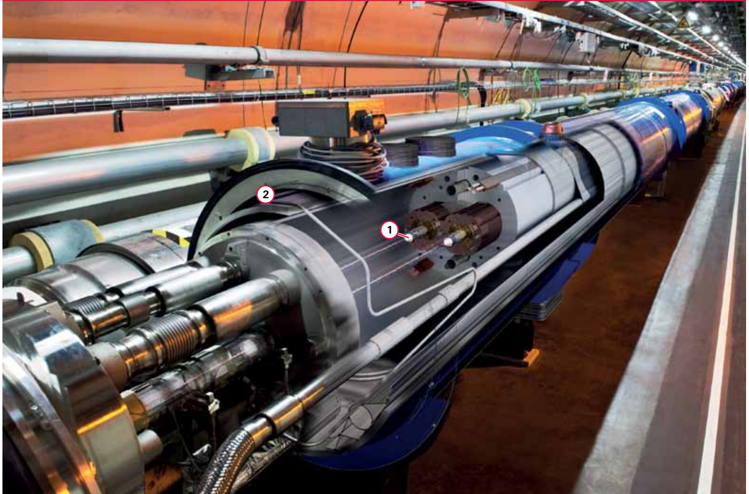
LHC加速器工程