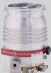
真空获得 HiPace 300