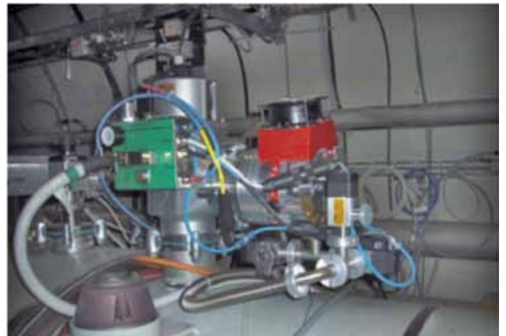
利用HiPace300涡轮泵获得隔离真空