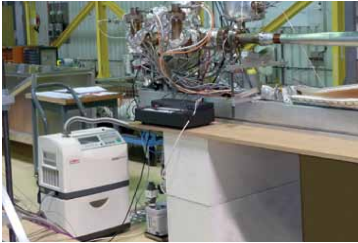
为LHC组件配置的ASM Graph系列检漏系统