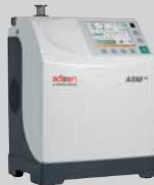
氦检漏 ASM 310