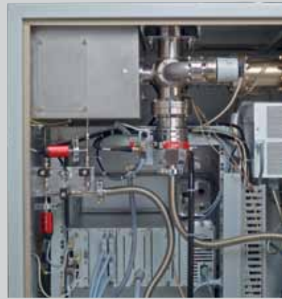
HiPace 80 和 IKR 251 以及 TPR 280 真空计