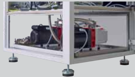
两台 Duo 6 M 磁耦合旋片泵