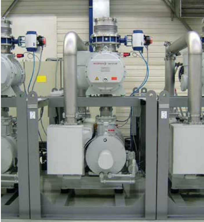
图 1：采用 HenaLine 的 CombiLine 泵站

被困在润滑油中的小气泡在真空状态下迅速膨胀。如果在排空前油里有例如 1 ml 空气，那么在真空压力为 1 hPa 的条件下将会膨胀到 1 l。这一过程会形成油沫。为了避免形成油沫，必须对其进行脱气处理。为此采用一个单独的真空装置进行持续脱气。