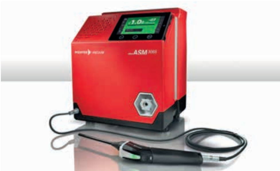
Lecksucher ASM 306 S mit Schnüffelsonde

Ist die Prüfung der einzelnen Komponenten erfolgreich abgeschlossen, werden im nächsten Produktionsschritt die einzelnen Komponenten zu einem System zusammengebaut und verschweißt. Nach einem optionalen Groblecktest mit Luft wird der Kältekreislauf evakuiert und gleichzeitig vakuumgetrocknet.