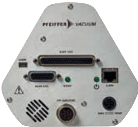
Abbildung 3: Schnittstellen an der aktuellen Version des Kompakt-QMS PrismaPro von Pfeiffer Vacuum