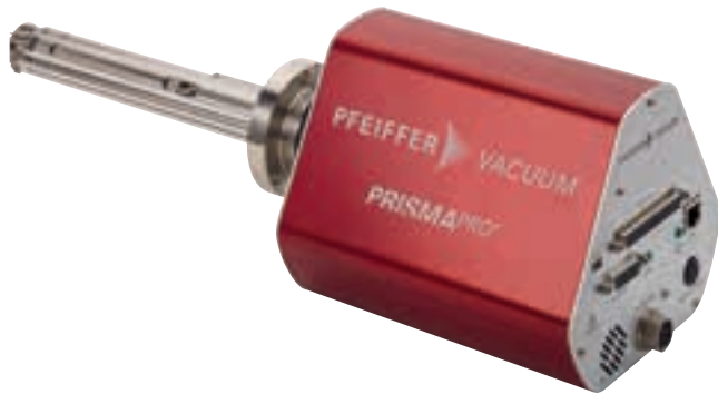
Abbildung 5: Das Kompakt-QMS PrismaPro von Pfeiffer Vacuum

Zum anderen ist die fortschreitende Miniaturisierung der QMS, insbesondere der Analysatoren, ein weiterer Trend. Relativ kleine Stabsysteme (zum Beispiel 12 mm Länge) haben sich bereits auf dem Markt etabliert – sie finden auch in größeren Stückzahlen Einsatz in Hochdruckanwendungen. Dank seiner kleineren Abmessungen kann solch ein QMS ohne zusätzliche Druckreduzierung und ohne eigenes Pumpsystem zur Prozessüberwachung bis hinauf in den Druckbereich von einigen E-2 hPa verwendet werden. Dies geht allerdings mit einer reduzierten Empfindlichkeit einher, die bei 10-fach kleineren Abmessungen um den Faktor 100 abnimmt [7].