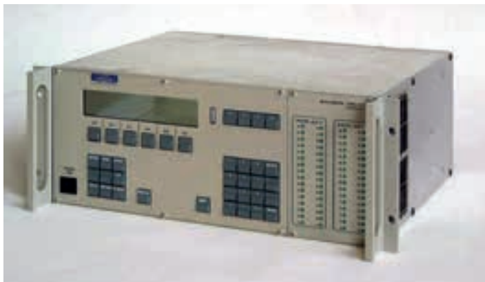
Abbildung 1: In den 1980er Jahren gebräuchliches Steuergerät QMS 420

der Daten wurde deutlich vereinfacht, außerdem wurde es dank der Programmierung von Sequenzen möglich, Messaufgaben automatisiert ablaufen zu lassen. Für Serviceaufgaben wie die Einstellung der Massenskala oder die Bestimmung der Empfindlichkeit existieren automatische Routinen. Viele Hersteller bieten darüber hinaus standardmäßig auch die Möglichkeit, quantitative Analysen über eine integrierte Matrixrechnung ablaufen zu lassen.