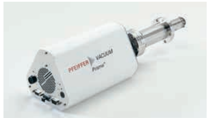
Abbildung 2: Beispiel eines der ersten Kompakt-QMS, dem Prisma von Pfeiffer Vacuum