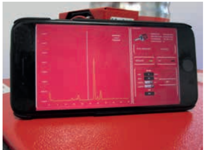
Abbildung 6: Web-UI eines QMS auf einem Smartphone

Das Produktportfolio von Pfeiffer Vacuum umfasst ein breites Spektrum an Analysegeräten zur Gasbestimmung in verschiedenen Vakuumprozessen: Vom Massenspektrometer bis zum komplexen Analysesystem. Die Basis für die meisten Lösungen zur Analyse ist unser Massenspektrometer PrismaPro. Das Prisma ist ein universell einsetzbares Massenspektrometer mit