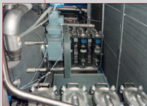
图2：用于分选和回收冷却剂、碎屑和生产残留物的过滤装置