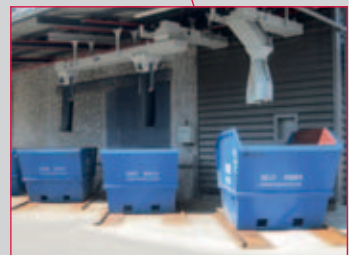
图1：用于消除污染的工业清洁机