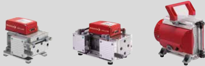
MVP 015-2 DC