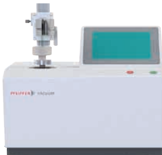
Abbildung 6: Lecksucher für MALL-Tests von Pfeiffer Vacuum (Konzeptionelle Planung)

Pfeiffer Vacuum bietet eine große Vielfalt an verschiedenen Dichtheitsprüfverfahren, um den verschiedenen Herausforderungen in der Pharmaindustrie gerecht zu werden, weil es keine einzelne Lösung gibt, die für alle mit einem bestimmten Produkt verbundenen Herausforderungen passt. Pfeiffer Vacuum kann Sie während der kompletten CCIT-Prozessdefinition und -integration unterstützen und auch GMP-Unterstützung bezüglich IQ/OQ (Installationsqualifizierung/Betriebsqualifizierung) bieten, einschließlich der erforderlichen Dokumentation für alle unsere Testmethoden. Der folgende Überblick gibt Ihnen einen Eindruck von der Palette an Dichtheitsprüfverfahren von Pfeiffer Vacuum.