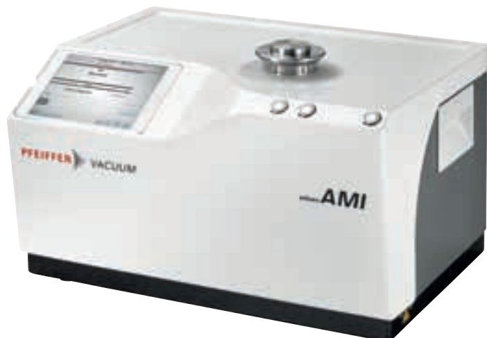
Abbildung 8: Kompaktes Lecksuchsystem AMI von Pfeiffer Vacuum