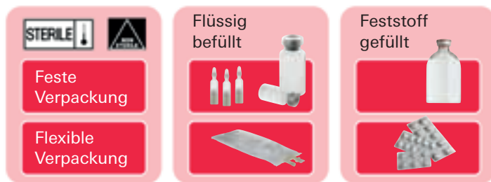
Abbildung 5: Konfigurations-Matrix Medikamente/Verpackungen

Abbildung 5 zeigt eine grobe Unterscheidung zwischen der großen Bandbreite an unterschiedlichen Verpackungen und Medikamententypen in der Pharmaindustrie. Nicht alle Testmethoden können für alle Arten von Verpackungen sowie alle Medikamententypen eingesetzt werden.