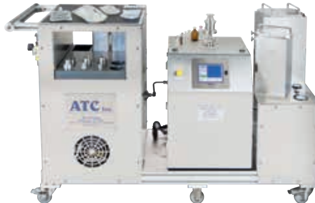
Abbildung 7: Mass Extraction System von Pfeiffer Vacuum

Der große Messbereich des AMI bietet eine höhere Empfindlichkeit als herkömmliche Tests, beginnend bei 0,5 µm (und kleiner) bzw. Leckraten bis 1 \cdot 10^{-6} mbar l/s, kann aber auch grobe Lecks identifizieren, wie zum Beispiel eine vollständig offene Verpackung. Dadurch kann das AMI-Gerät die Grob- und Feindichtheitsprüfung in nur einem Gerät durchführen. Das Verfahren liefert deterministische Testergebnisse mit hoher Wiederholgenauigkeit, unabhängig vom Anwender und mit Zuverlässigkeit und Genauigkeit im Bereich von USP 1207.1. Es kann in Labortests sowie als IPC (In Process Control) während der Produktionstests eingesetzt werden. Je nach Verpackung sind auch gleichzeitige Prüfungen mehrerer Teile möglich.