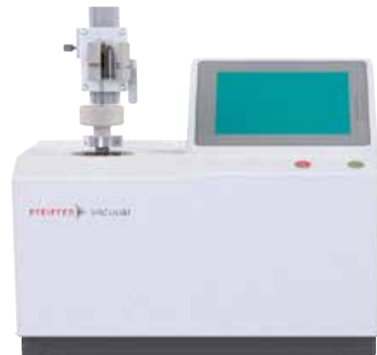
图 6 : 普发真空进行 MALL 测试的泄漏检测器 ( 概念设计 )

普发真空氦气泄漏检测解决方案非常适合制药行业的 MALL 测试。为了确保正确的测量, 在测量期间管理示踪气体浓度是非常重要的。处理小瓶或其他密封包装时, 这一点尤其棘手。因此, 普发真空提供完整的解决方案, 包括示踪气体处理和充入以及根据您的包装和测试室进行调整。