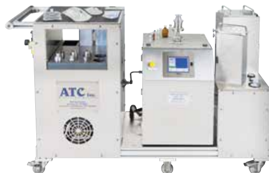
图 7：普发真空的质量提取系统

我们 USP <1207> 和 ASTM (F-3287-17) 认可的 Mass Extraction 技术的工作原理是基于稀薄气流。测试在真空条件下进行，以获得更高的灵敏度。这种专利技术类型的测试特别适用于药品包装，如输液袋、密封袋或玻璃瓶。使用该方法可以检测到更大的缺陷和小至 1 μm 的缺陷。因此，该技术适用于实验室应用以及在生产环境中的使用，允许稳定性控制以及自动 100% 测试 ( 也在内联机器中 )。美国的 FDA 实验室和主要的制药公司已经使用质量提取仪器超过 10 年。