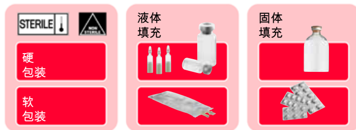
图 5：药物/容器配置单

在包装的早期开发阶段（“包装设计阶段”），供应商有义务确保包装在设计上能够保证无菌。因此，需要对包装进行 0.2 μm 范围内的缺陷测试，分别为 6 \cdot 10^{-6} mbar l/s (MALL)。这些是目前对装满药物的容器的稳定性和质量控制的要求。完整性测试主要在 2 至 20 μm 的缺陷尺寸范围内进行。其主要原因是可用方法在合理的测试时间内检测较小缺陷的可行性。当处理以 120 至 600 份/分钟的速度运行的生产线的 100% 检查时，允许的缺陷尺寸有时甚至增加到显著更高的水平。生产单元的检测限 (LOD) 定义为成本、技术和产品之间基于风险的决策。为了补偿这种基于风险的方法，进行额外的离线样品测试，以达到 1 至 10 μm 范围内更严格的规格。这也适用于在实验室测试中进行的稳定性测试。同样，灵敏度比测试时间更重要。