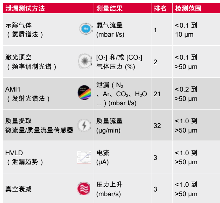
图 5 给出了制药行业中各种不同包装和药物类型的粗略区别。并非所有测试方法都可用于所有类型的包装以及所有类型的药物。

除了下面提到的包装类型的特征之外，诸如包装的透明性和其导电性之类的特征在选择正确的完整性测试方法方面也起着重要作用。以下表 1 给出了可供使用的 CCIT 方法更详细的概述，并通过指出具体特征以及不同测试方法的局限性提供了选择的指导：