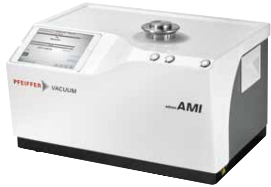
图 8 : 普发真空紧凑型泄漏测试系统 AMI

AMI 的广泛测量范围提供比传统测试更高的灵敏度，从低至 1 \cdot 10^{-6} mbar l/s 的 0.5 \mu\text{m} (和更小) 的相应泄漏率开始，但也可以识别粗略泄漏，例如完全打开的容器。因此，AMI 设备可以在一个设备中执行粗略和精细的泄漏测试。无论什么用户，该程序都能提供具有高重复性的确定性测试结果，并且具有 USP 1207.1 范围内的可靠性和准确性。它可以在生产测试期间用于实验室测试以及 IPC (过程控制)。根据包装的不同，同时也可对多个部件进行同步测试。