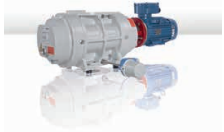
그림 3: Okta 500 ATEX

구상에서 구현에 이르기까지 파이퍼 베콤의 전문가가 화학 산업의 다양한 분야에 종사하는 모든 고객과 긴밀히 협력하면서 개별 응용 분야의 요구사항에 꼭 맞는 맞춤형 솔루션을 개발합니다.