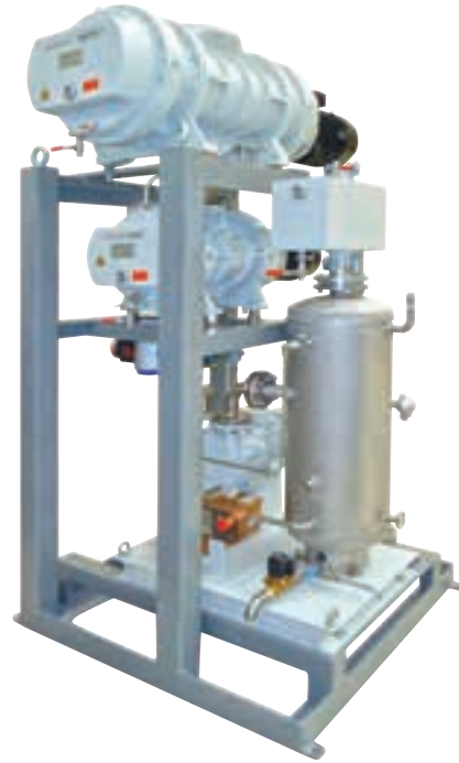
그림 2: 증류 공 정용 3단계 펌핑 스테이션

Okta의 기체 순환 냉각식 버전은 대기압으로 압축할 수 있어 주로 화학 산업의 중요한 공정에서 사용됩니다. 표준 펌프는 구상흑연 주철(GGG40)으로 만들어지기 때문에 펌프 하우징이 고압 충격 (16 bar)을 확실하게 견딜 수 있습니다. 이는 특히 ATEX 응용 분야에서 중요합니다. 특히 부식성이 강한 응용 분야의 경우에는