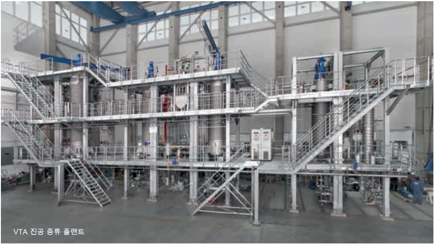
VTA 진공 증류 플랜트

화학 산업은 많은 경제 부문에 원자재를 공급하는 필수불가결한 산업입니다. 예를 들어 자동차 산업, 기계 공학, 플라스틱, 식품, 유리 또는 건축 자재 산업은 모두 화학 산업에서 생산되는 물질을 사용합니다. 이 물질들은 우리가 매일 사용하는 무수한 완제품에 사용됩니다. 이러한 응용 분야의 대부분에서 진공 기술이 사용됩니다. 가장 중요한 응용 분야 중 하나가 진공 증류입니다.