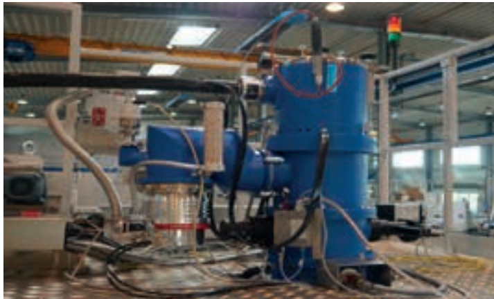
电子束发生器处的 HiPace 涡轮分子泵

电子束焊接可以帮助许多行业的制造商实现更高的生产效率、更高的产品质量和更快的周期。尽管在实践中这是一种可出售的既定工艺，但必须考虑一些特殊要求以确保安全、稳定的过程。因此，用户不仅应注意使用寿命长且维护成本低的一流机械和设备，还应选择专业的合作伙伴作为其供应商，因为此类合作伙伴了解生产中的特定要求并能提供最可靠的、量身定制的解决方案。作为一家具有悠久传统以及在真空解决方案的设计和建造方面拥有 100 多年经验的创新公司，普发真空拥有必要的专业知识，可以帮助各行各业的用户取得成功。