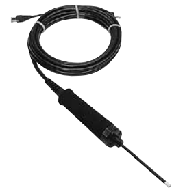
吸枪探头 LP 505