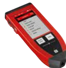
远程控制器 RC 10

作为一种拓展，ASM 340 也可不配备前级泵。这款 ASM 340 I 允许连接不同的前级泵，以更方便地使用和更好地适应客户应用，例如在集成到检漏系统的情况下。外部前级泵的连接位于检漏仪的后部。