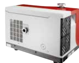
ASM 340 I